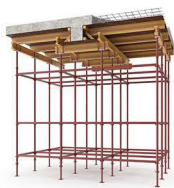
Опалубка перекрытий на объемных стойках