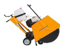
Резчик швов (бензиновый, электрический)