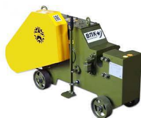
Станок для рубки арматуры