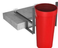
Мусоропровод строительный (Мусоросброс)