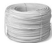
Кабель ПНСВ, ПТПЖ