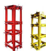
Кондуктора для монтажа колонн