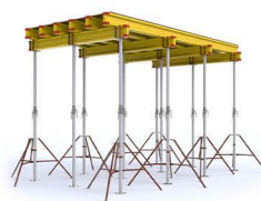
Опалубка перекрытий на телескопических стойках