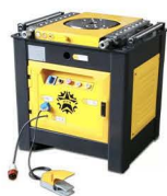
Станок для гибки арматуры