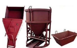
Бадья для подачи бетона (1-2 м 2 )