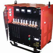
Трансформатор для прогрева бетона (20-80 кВт)